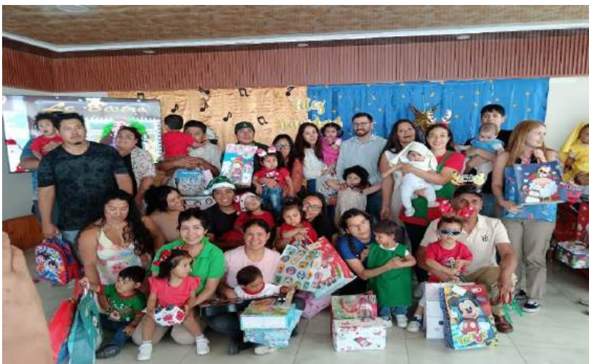
Navidad 2025 con niños, niñas, familias y equipo educativo